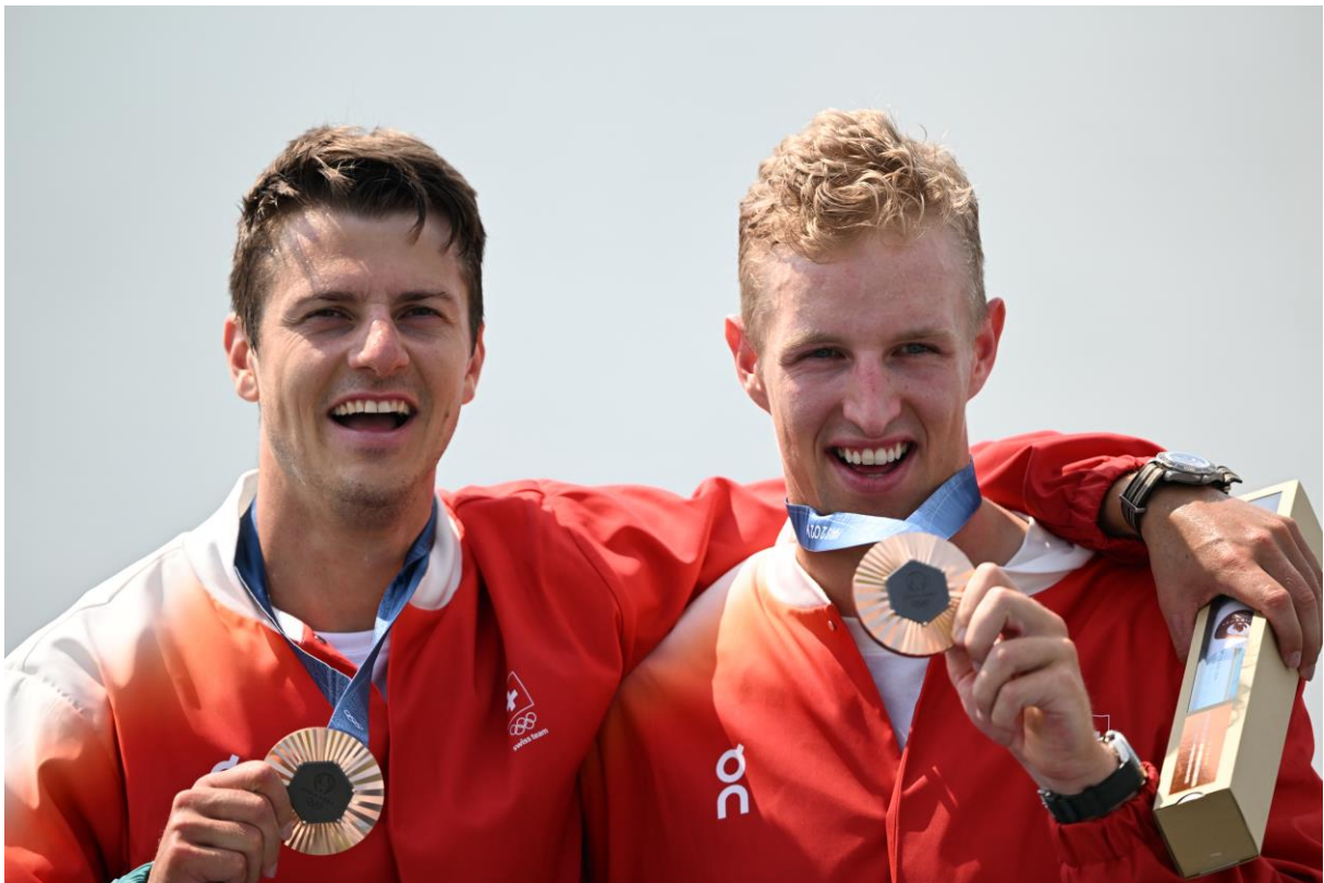
Andrin Gulich (Seeclub Küssnacht) und Roman Rössli (Seeclub Sempach) rudern in einem spektakulär verlaufenen Olympiefinal der Olympischen Spiele Paris 2024 am 2. August 2024 im Zweier ohne Steuermann zur olympischen Bronzemedaille. Damit gewann das Duo sowohl in der Saison 2023 als auch in der Saison 2024 an jeder internationalen Regatta eine Medaille.