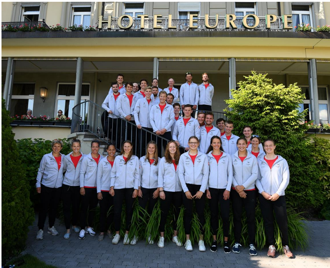
Mannschaftsfoto SWISS ROWING Team an der EM 2019 in Luzern