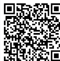
Road to Paris 2024

Cette offre de formation est soutenue et mise en œuvre par SWISS ROWING. Elle s'adresse aux membres actuels et futurs de comité. Les personnes intéressées trouveront des informations complémentaires sur : Swiss Olympic - Formation Swiss Olympic « Club Management »