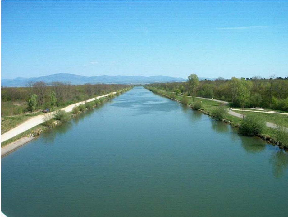
Vue du "Pont du Bouc" direction Allemagne –Suisse (Est)

Le bassin est le canal à grand gabarit Rhin-Rhône sur le bief de Niffer. Il bénéficie d'une ligne droite de plus de 6000 m idéale pour l'organisation de têtes de rivière à l'abri des vents dominants.