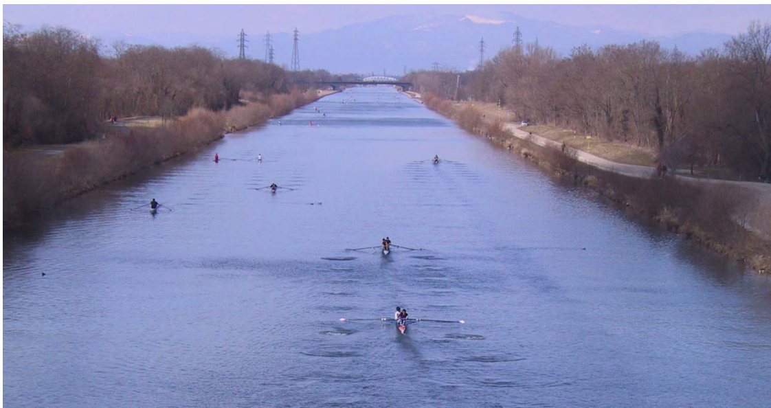
Vue du "Pont du Bouc" direction Mulhouse Vosges (Ouest)